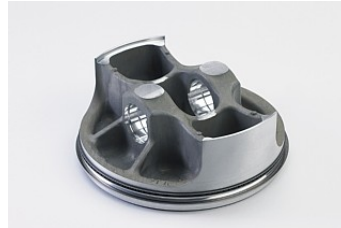
Hochleistungskolben mit Bridged-Box-Boden