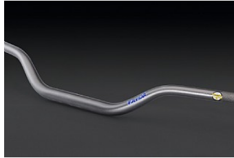
RENTHAL FATBAR Preis ab CHF 196.55