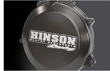
HINSON KUPPLUNGSDECKEL CHF 269.90