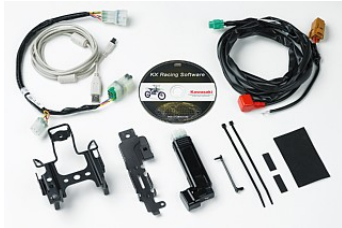
Motocross-Steuergerät mit Programmierung der Motorkennlinie