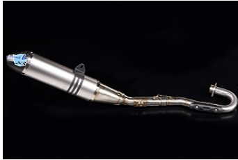
LEOVINCE KOMPLETTANLAGE Preis ab CHF 1'190.00

Dieses Teil / diese Teile sind ausschließlich für den Wettbewerbs- oder Rennsinsatz bzw. wettbewerbsähnliche Veranstaltung Diese Teile sind von den Kawasaki Garantiebestimmungen ausgenommen.