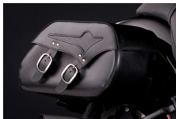
SATTELTASCHEN Preis ab CHF 699.00