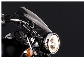
WINDSCHUTZSCHEIBE CAFÉ CHF 259.00