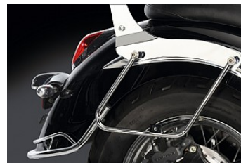
SATTELTASCHENHALTER, SET CHF 109.90