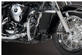
SCHUTZBÜGEL CHF 249.00