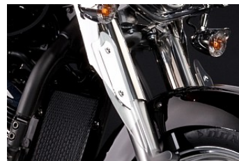
WINDABWEISER CHF 179.00