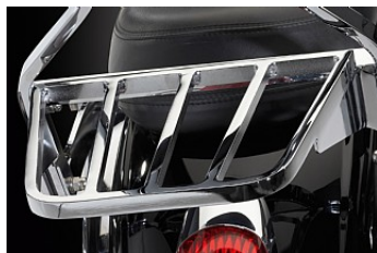
REARRACK CHF 416.90