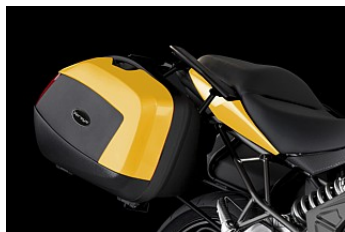
MOTORRADKOFFER 2x35L CHF 549.00