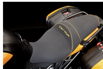
NIEDRIGERER GELSITZ CHF 499.00