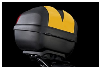
TOPCASE 30L CHF 99.00