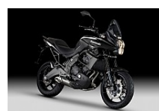
Metallic Spark Black