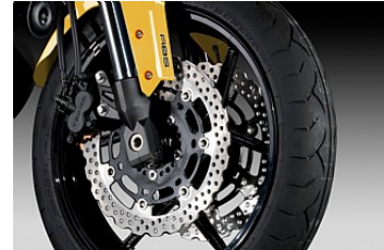
Bremsen mit ABS