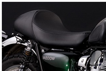
CUSTOM SITZBANK CHF 590.00