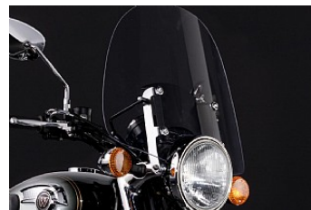
WINDSCHILD CHF 590.00