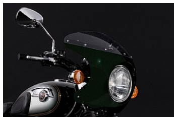
VERKLEIDUNG "BIKINI" CHF 790.00