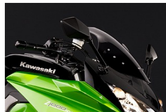
GETÖNTE SCHEIBE CHF 149.00