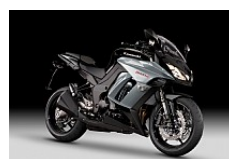
Metallic Spark Black / Metallic Flat Micron Gray