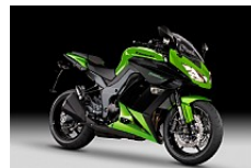
Candy Lime Green / Ebony

Alle Preise verstehen sich als netto inkl. 8% MWST exkl. Ablieferungspauschale. Gültig ab 01.12.2011