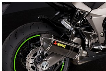
AKRAPOVIC-AUSPUFF* CHF 1'629.00