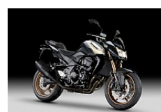
Metallic Spark Black