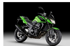
Candy Lime Green

Alle Preise verstehen sich als netto inkl. 8% MWST exkl. Ablieferungspauschale. Gültig ab 01.12.2011